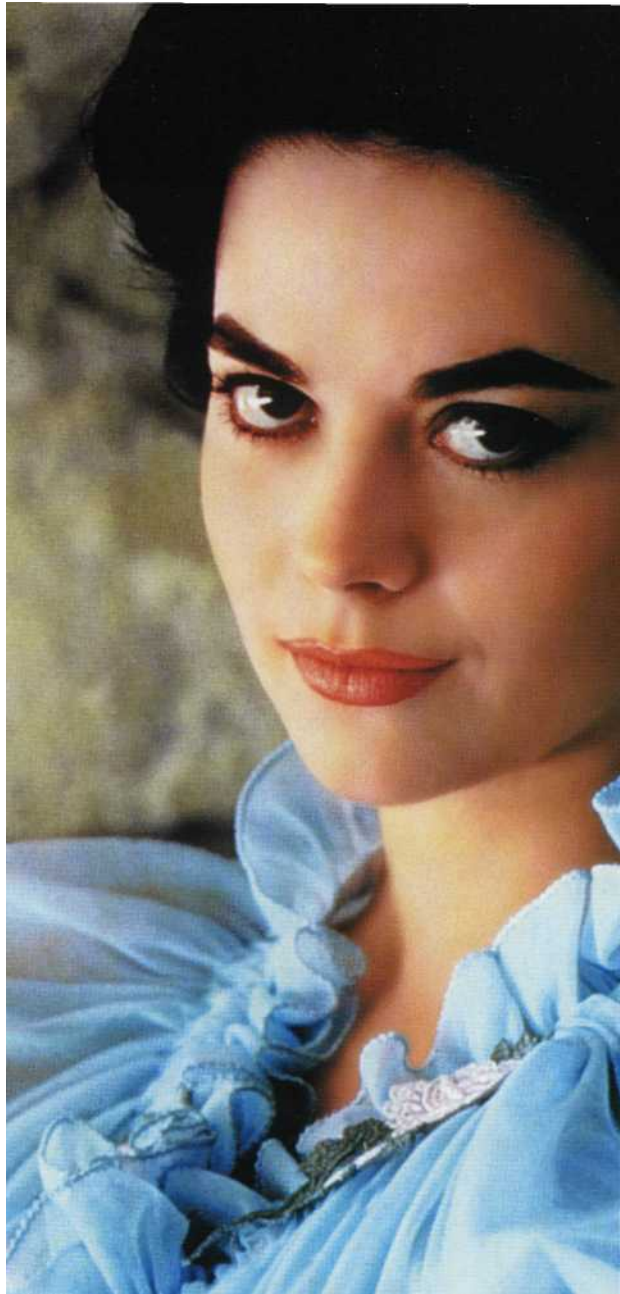
Все магазины Америки были увешаны рекламными плакатами с лицом Вуд: «Храните ваш возраст в секрете»

...Ее тело нашли ранним утром в воде, недалеко от Голубой бухты острова Каталина. Рядом — шляпка со «Сплендора» с поднятыми веслами и выключенным мотором. Полиция допросила всех пассажиров «Сплендора», но никто не мог вразумительно объяснить, что же случилось с Натали. Дело закрыли, объявив потрясенной Америке, что произошел несчастный случай: после ссоры с мужем актриса спустила шляпку на воду, а когда отплыла достаточно далеко, устала, уснула и не за-