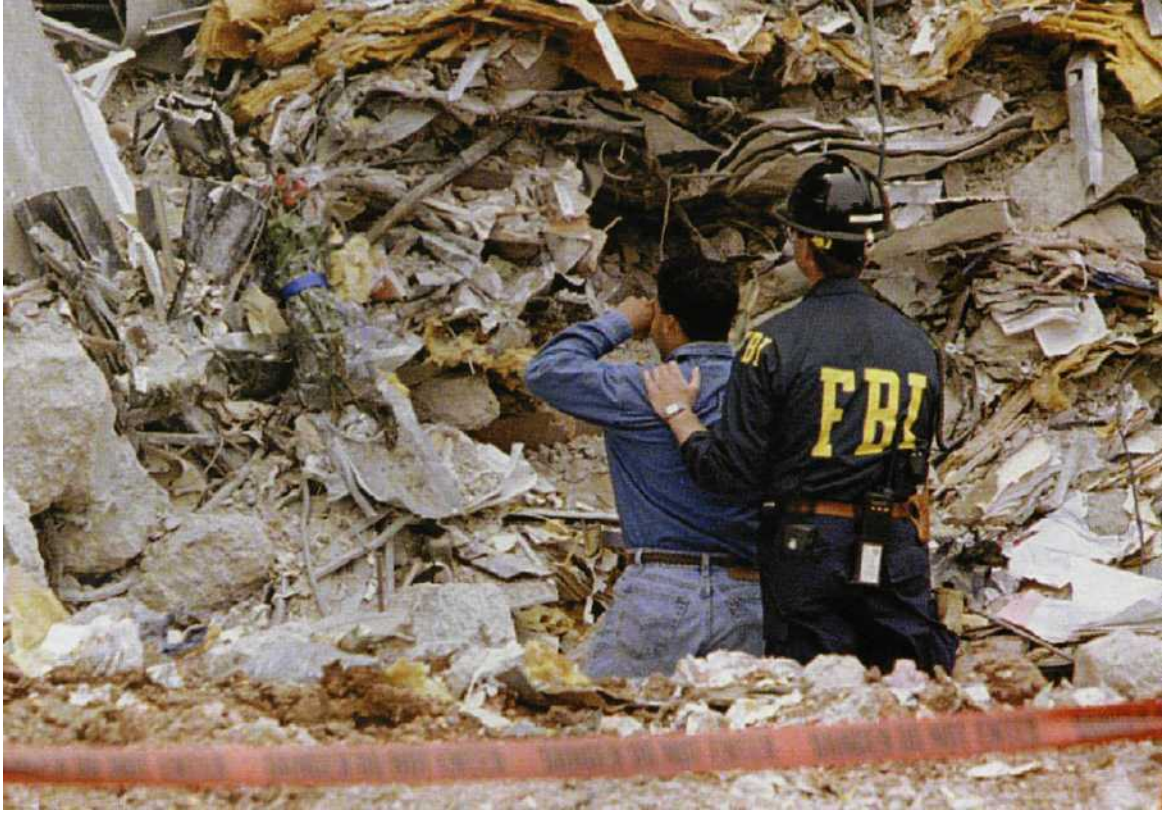
Взрыв в Оклахома-сити стал самым крупным терактом за всю историю Америки. Погибли 167 человек, в том числе 19 детей, более 500 человек получили тяжелые ранения

шил учиться тому, что с некоторых пор считал единственно важным — самообороне, и армия показалась ему самым подходящим для этого местом. Он был зачислен в пехотный полк.