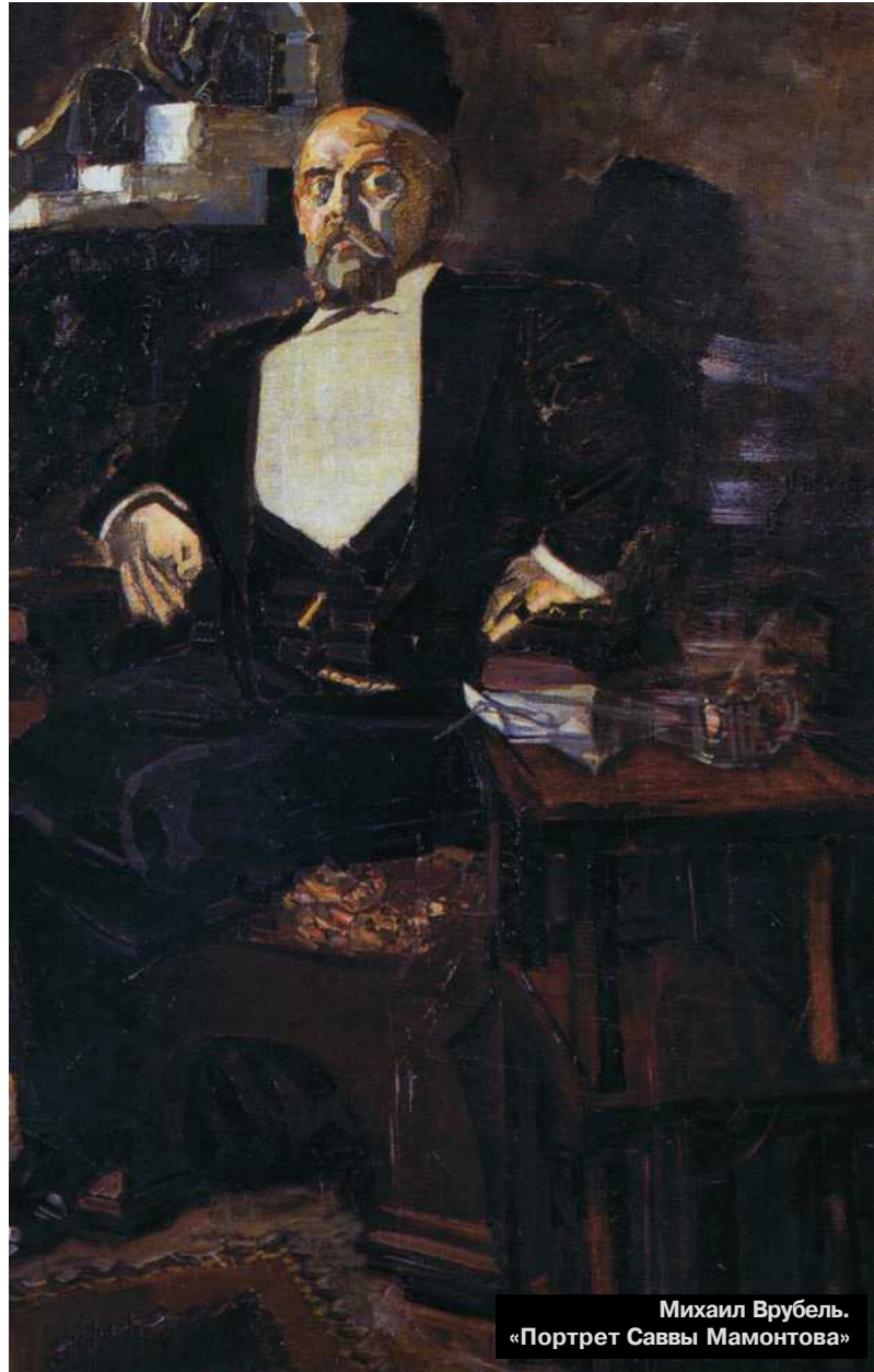
Михаил Врубель. «Портрет Саввы Мамонтова»