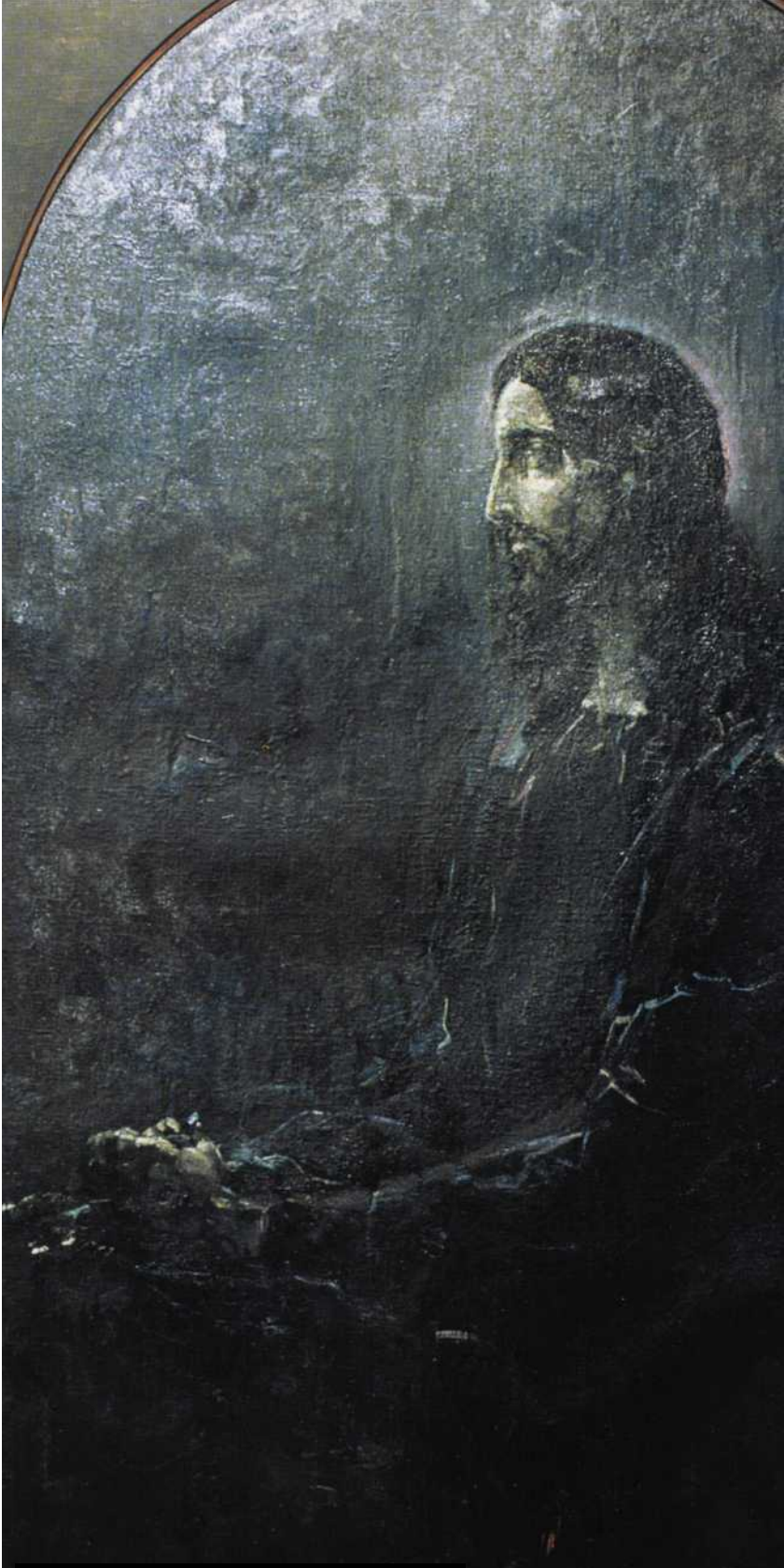
Когда-то он приехал в Киев расписывать Кирилловскую церковь. Для 28-летнего безвестного художника это был первый крупный заказ, и Врубель им очень гордился

..День выдался морозный и солнечный — редкость для Петербурга. Врубель шел по Невскому в полном блаженстве: он только что получил деньги за картину, огромную сумму. Зашел в Торговые ряды. Ему понравилось кружевное платье за 500 рублей и шляпка за 60, и он приобрел их для Наденьки. А затем еще долго ходил, покупая массу забавных красивых вещиц вроде громадного китайского ящика для чая, обитого шелком. Он бы так счастлив, когда появился на пороге с подарками, а Надя расстроилась: посчитала, что Миша сильно возбужден и напрасно сорит деньгами. Уж не рецидив ли это болезни? Ей со