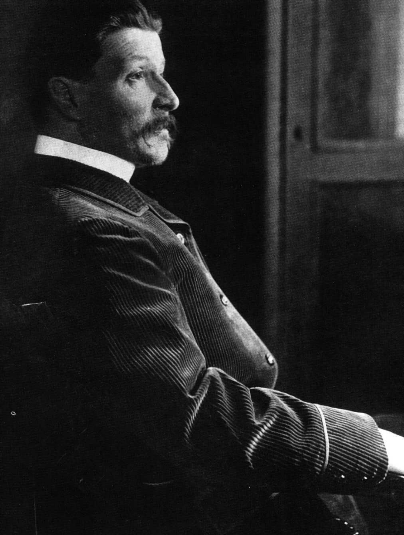
Внешне Врубель ничем не походил на художника — подчеркнуто щеголеват, никакой небрежности в одежде. Богемный стиль ему претил