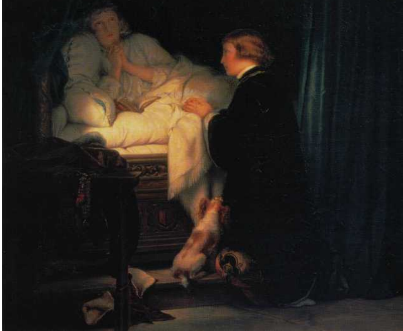
«Дети Эдуарда IV». Поль Деларош, 1831 г.

мет на себя дядюшка, этот двуличный горбун, которому она никогда не доверяла.