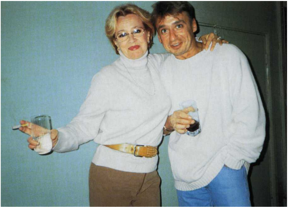
С актрисой Мариной Нееловой