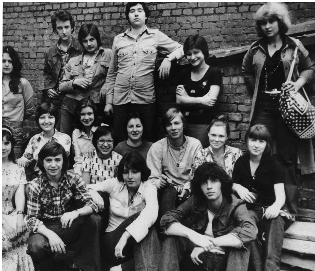
Один из первых выпусков легендарной 127-й школы рабочей молодежи