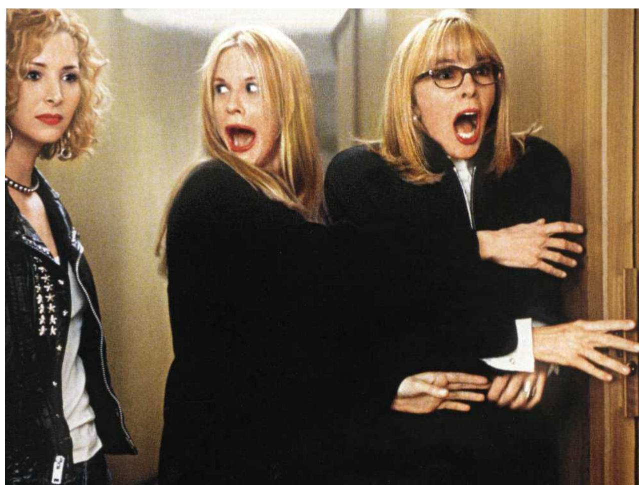
Лиза Кудроу, Мег Райан и Дайен Китон в фильме «Отбой» (2000 г.)