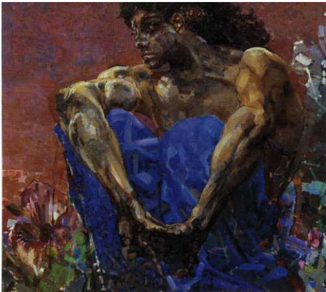
Фото репродукции картины Михаила Врубеля «Демон сидящий». 1890 г. Государственная Третьяковская галерея, Москва