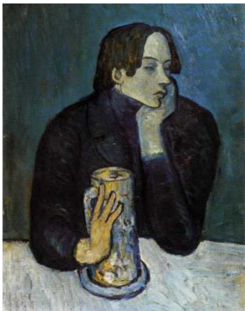
Фото репродукции картины Пабло Пикассо «Портрет поэта Сабартеса (Кружка пива)». 1901 г. ГМИИ им. А.С. Пушкина, Москва