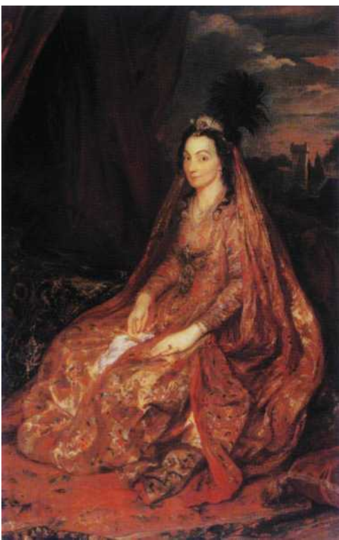
Фото репродукции картины А. Ван Дейка «Леди Тереза Ширли». 1622 г. Пелтвот Хауз, Национальный Трест, собрание Эгремонта