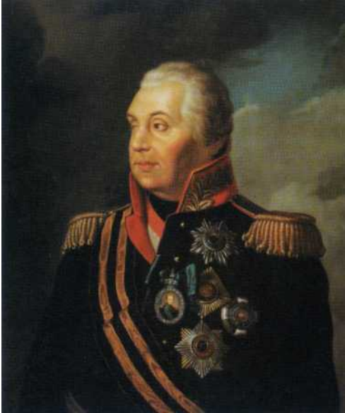
Фото репродукции картины Н. Яш «Портрет М. И. Кутузова». 1883 г.