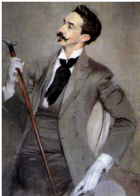
Фото репродукции картины Джованни Болдини «Граф Роберт де Монтескью». 1897 г. Музей д'Орсе, Париж