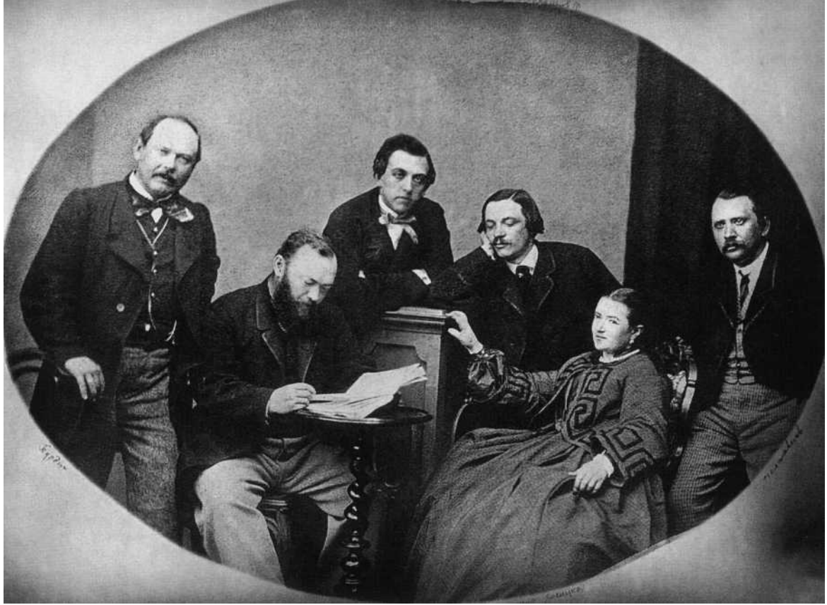
Косицкая была одной из первых, кому Островский прочел «Грозу»

Косицкой было 32 года, женихи дважды бросали ее перед венцом, а третий, хоть и дошел до алтаря, вскоре исчез из ее жизни, кочуя из одной провинциальной труппы в другую. Она слишком хорошо знала, что значит быть брошенной, и не желала такой доли ни одной женщине, даже сопернице, с которой придется делить любимого.