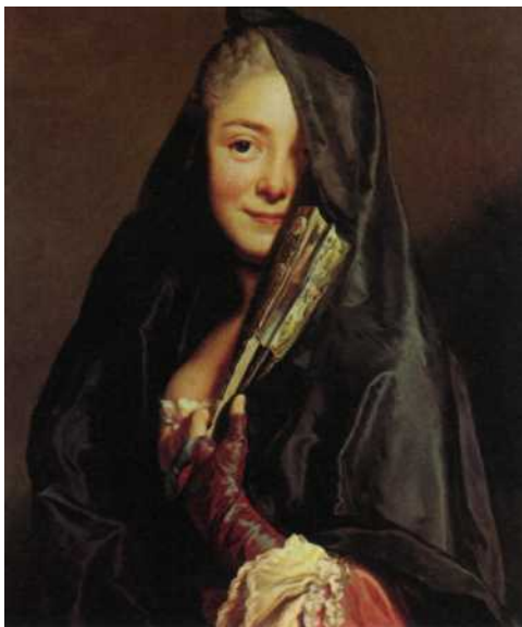
Фото репродукции картины А. Рослина «Дама с веером: Мари Сюзанна Рослин». 1768 г. Национальный музей, Стокгольм