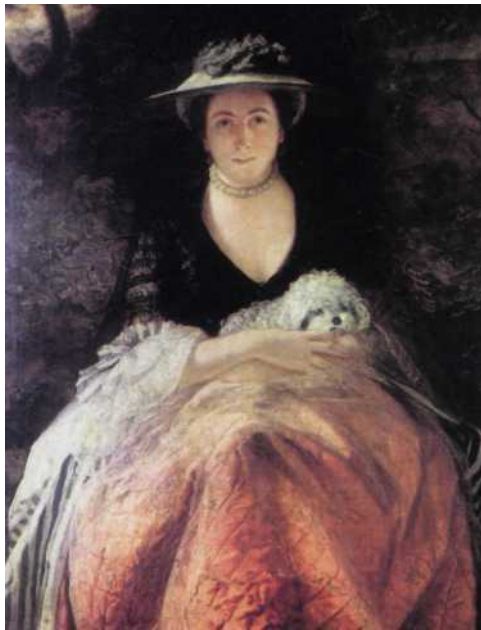
Фото репродукции картины Джошуа Рейнольдса «Портрет Нелли О'Брайен». 1760—1762 гг. Собрание Уоллес, Лондон