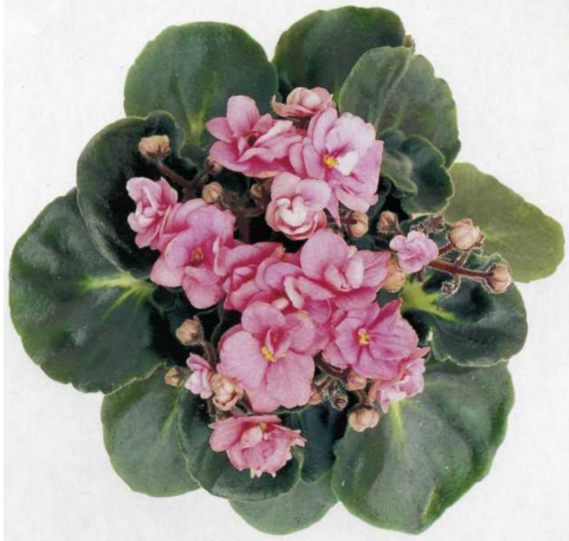
Наталья Селезнева. Фиалка