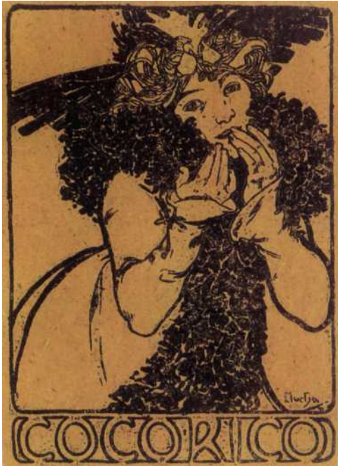
Альфонс Муха. Фото репродукции рисунка «Двенадцать месяцев: ноябрь» для обложки журнала «Кукареку». 1899 г.