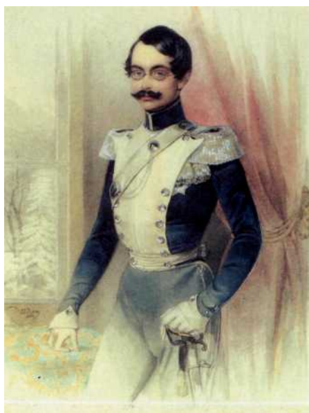
Фото репродукции картины из частного собрания. Акварель, начало XIX века