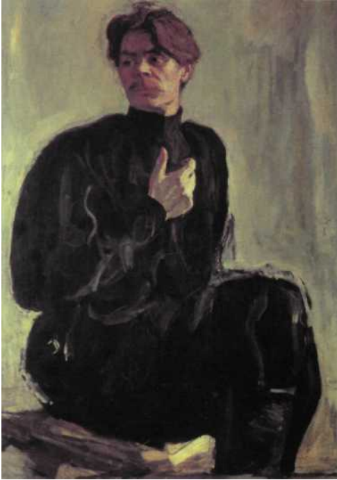
Фото репродукции картины В. Серова «Портрет писателя А.М. Горького». 1904 г. Музей А.М. Горького, Москва